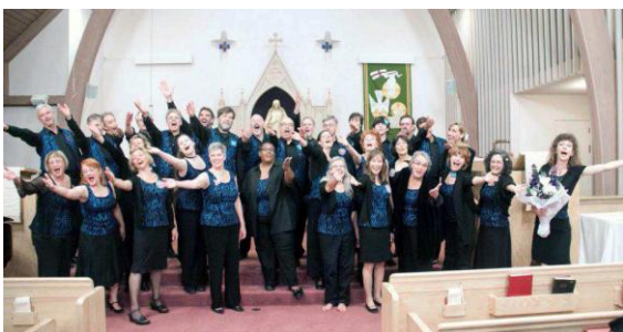
Northwest Firelight Choral

par la Chorale de Seattle, du Nord-Ouest des Etats-Unis, la